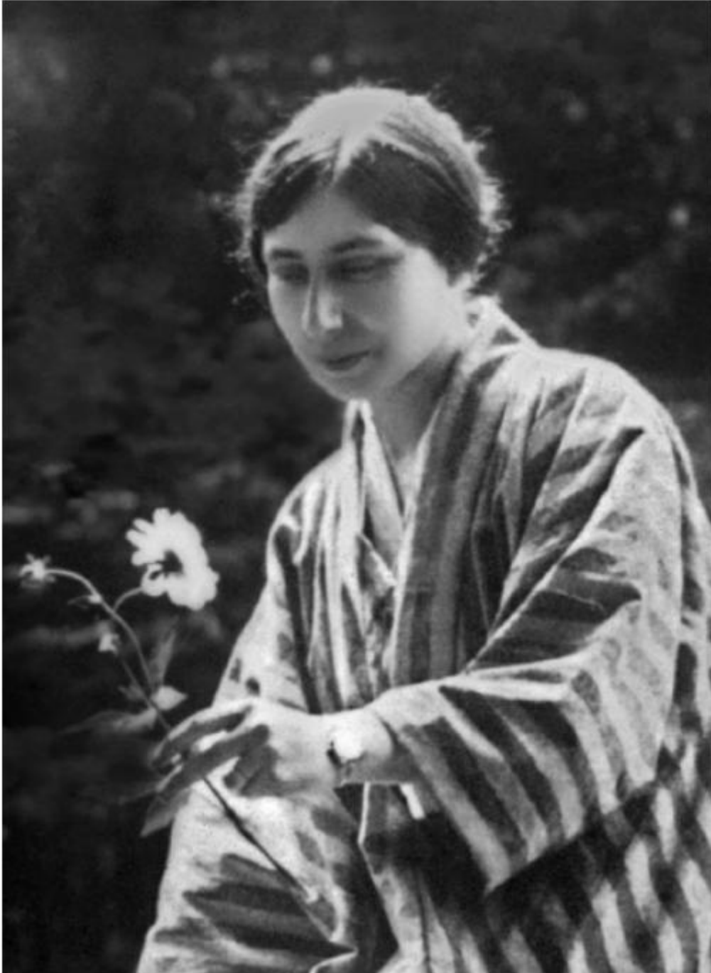
De Moeder in Tokyo, 1916