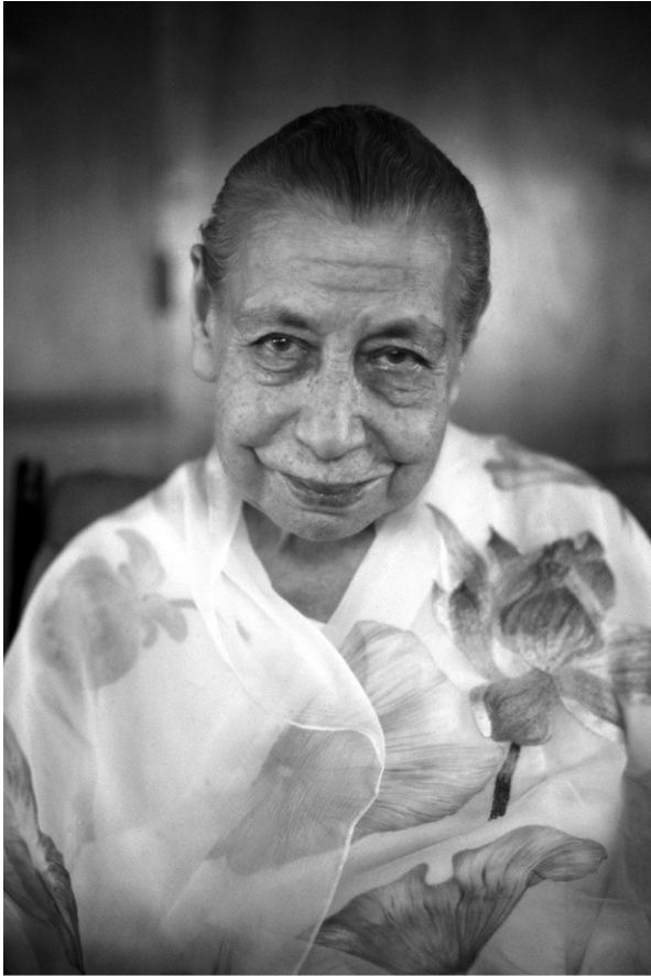
De Moeder in 1970