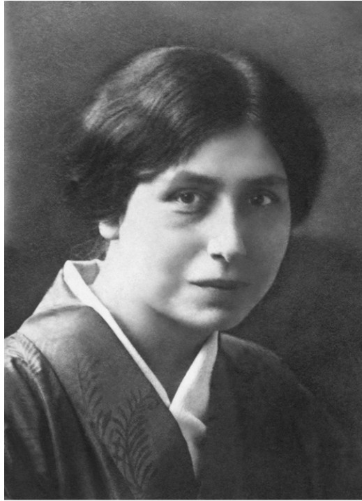
Mirra Alfassa in Japan