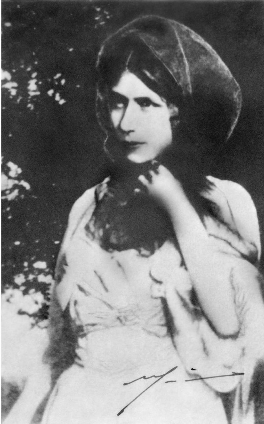
De Moeder in Algerije, 1906-1907