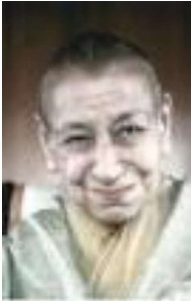
De Moeder – 1969